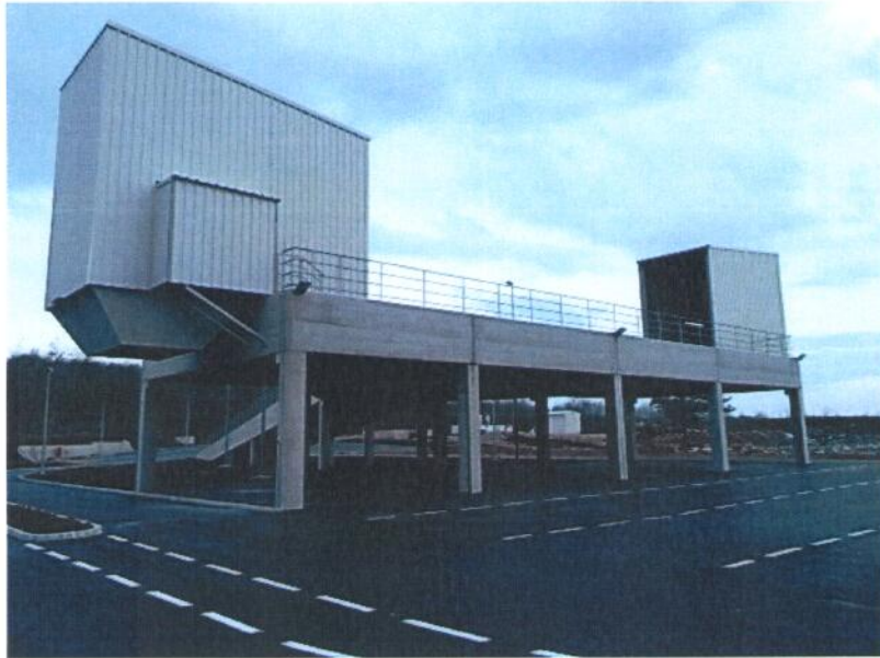
Slika : Pretovarna stanica na odlagalištu komunalnog otpada „Cere“

U ovoj godini očekuje nas izgradnja sortirnice i reciklažnog dvorišta u sklopu 3. faze sanacije i rekonstrukcije odlagališta Cere te dodatna ulaganje u komunalnu opremu. Nadamo se uspješnoj suradnji sa Fondom koji će pratiti spomenute projekte u vidu sufinanciranja.